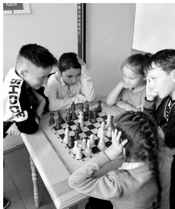
Путешествие в шахматное королевство

Профком пригласил педагогов, а это в основном женщины-хозяйки, поделиться своими рецептами заготовок