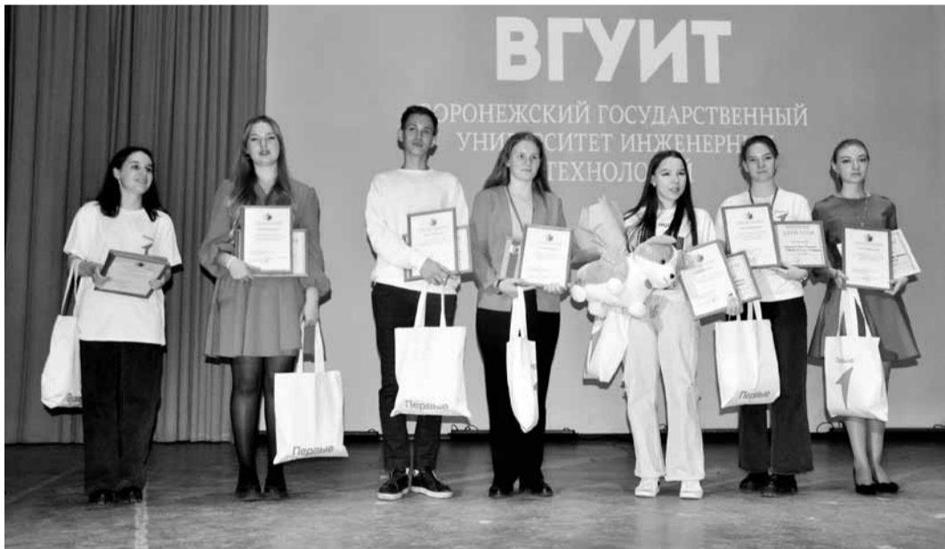
Участники конкурса с наградами и подарками