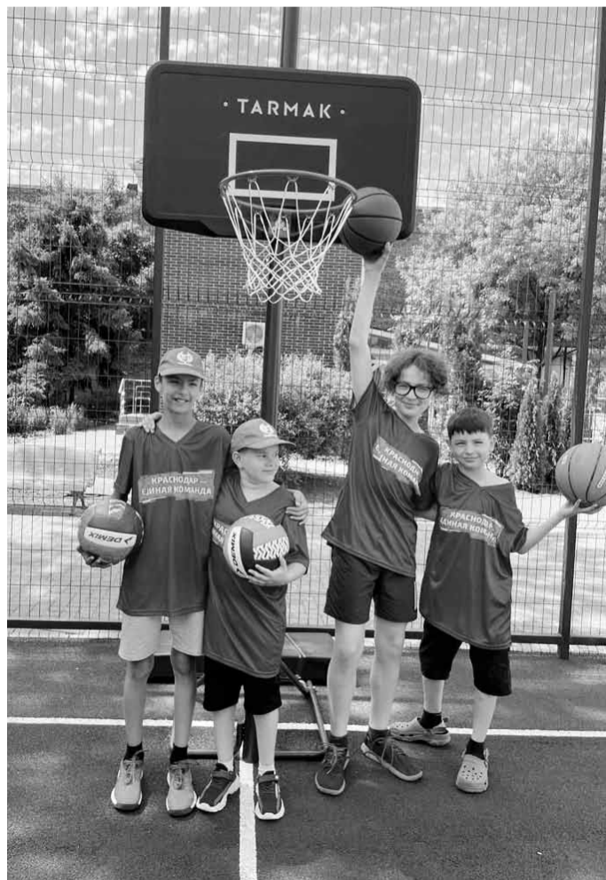
В профлагере ребята играют в спортивные игры

За период работы учебного центра в нем прошли обучение более 3000 слушателей по наиболее востребованным образовательным программам по охране труда, оказанию первой помощи, пожарной