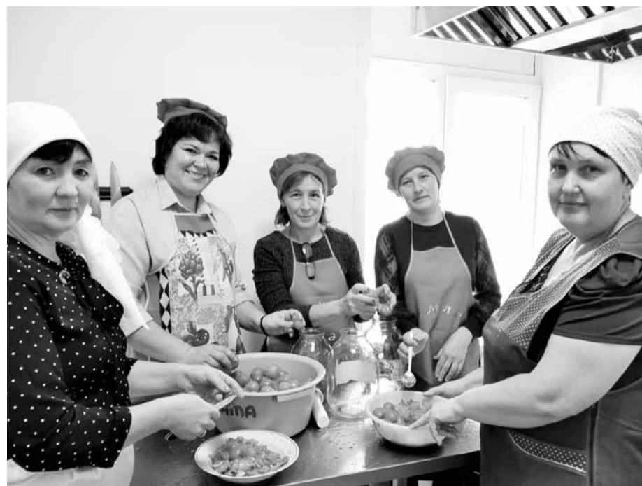
Делаем заготовки на зиму