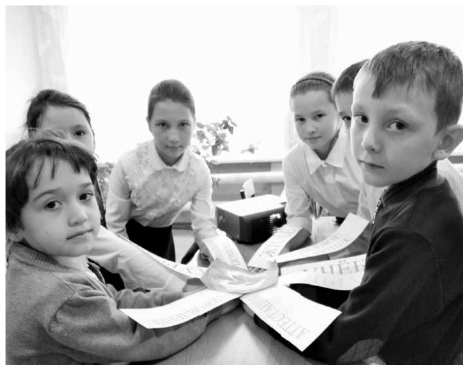
Знает каждый карапуз, что такое профсоюз

билеты разных поколений, планы и протоколы профсоюзной организации прошлых лет, написанные от руки. Среди экспонатов - брошюры профсоюза, отраслевые соглашения разных лет, коллективные договоры, старые фотографии, вырезки из газет. Гости с удовольствием слушали, с любопытством рассматривали экспонаты и задавали вопросы. Ветераны профсоюза - учителя старшего поколения - дополнили мой рассказ своими воспоминаниями. По окончании экскурсии гости поблагодарили профком школы за организацию такого мини-музея и взаимодействие «века нынешнего и века минувшего».