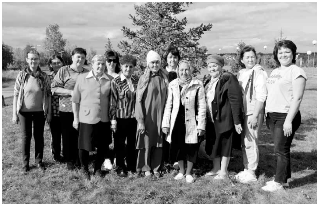
Педагоги-ветераны активно провели время на свежем воздухе

Сегодня в рамках тематической недели спортивный день. Утренняя зарядка, велопробег, пешеходная прогулка, соревнования в различных видах спорта, лекции о здоровом образе жизни и даже катание на лодках по реке прошли под общим девизом «Зарядись энергией профсоюза». Заряд бодрости от этой акции получили не только ученики и учителя, но и ветераны педагогического труда, которые сейчас находятся на заслуженном отдыхе. Мы демонстрировали жителям деревни, что выбрали здоровый образ жизни. Отзывы ветеранов: «Мы все взбодрились, активно провели время на свежем воздухе. Спасибо профсоюзу!»