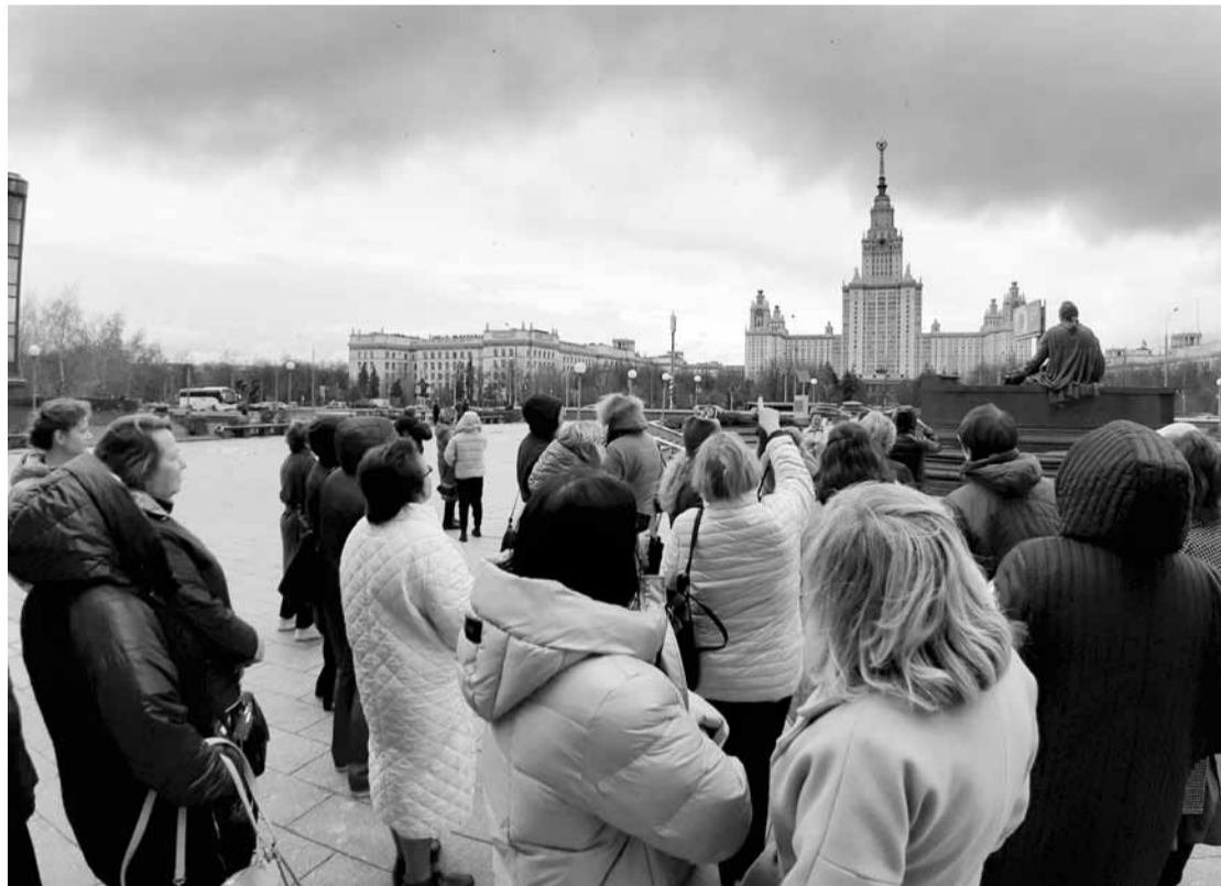
Прогулка по Москве

кураторов психолого-педагогических классов