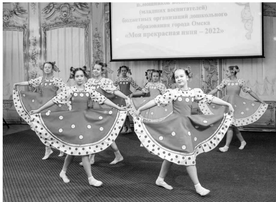
Выступление танцевального коллектива Дома творчества