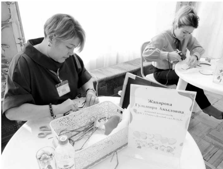
Умелые руки не знают скуки

Няни умеют и ребенка успокоить, и родителей уговорить