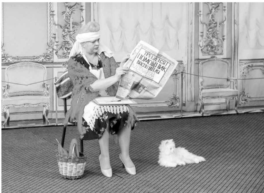
Каждая няня - актриса