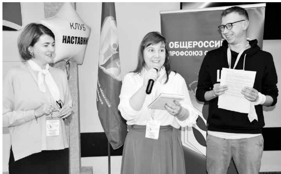
Задание по журналистике выполнено. Отчитывается команда «зеленых»

Мои студенческие годы в Мордовском государственном университете неразрывно связаны с профсоюзом. Мы участвовали в спортивных состязаниях, получали подарки на Новый год и были заняты во всех мероприятиях, проводимых профсоюзом. Но самый активный период начался у меня, когда я приступила к работе в школе. Конечно же, я сразу вступила в профсоюз. Первым событием, в котором я приняла