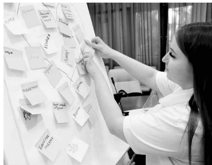
Игра «Что ты знаешь о профсоюзе?»