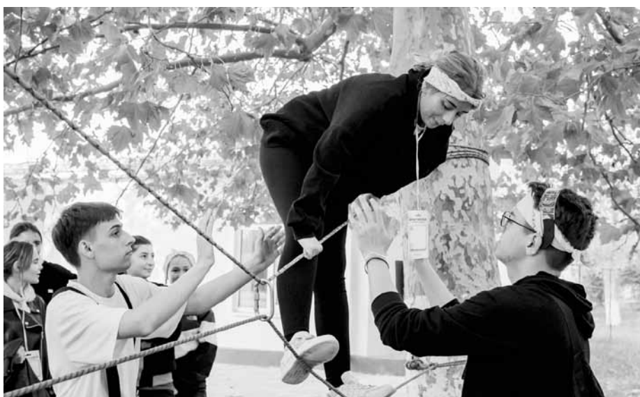
Комбинированный туристический маршрут

В тот же день после занятий ребятам предстояло пройти комбинированный туристический маршрут (КТМ), который включал в себя ориентирование на местности и проверку физической подготовки.