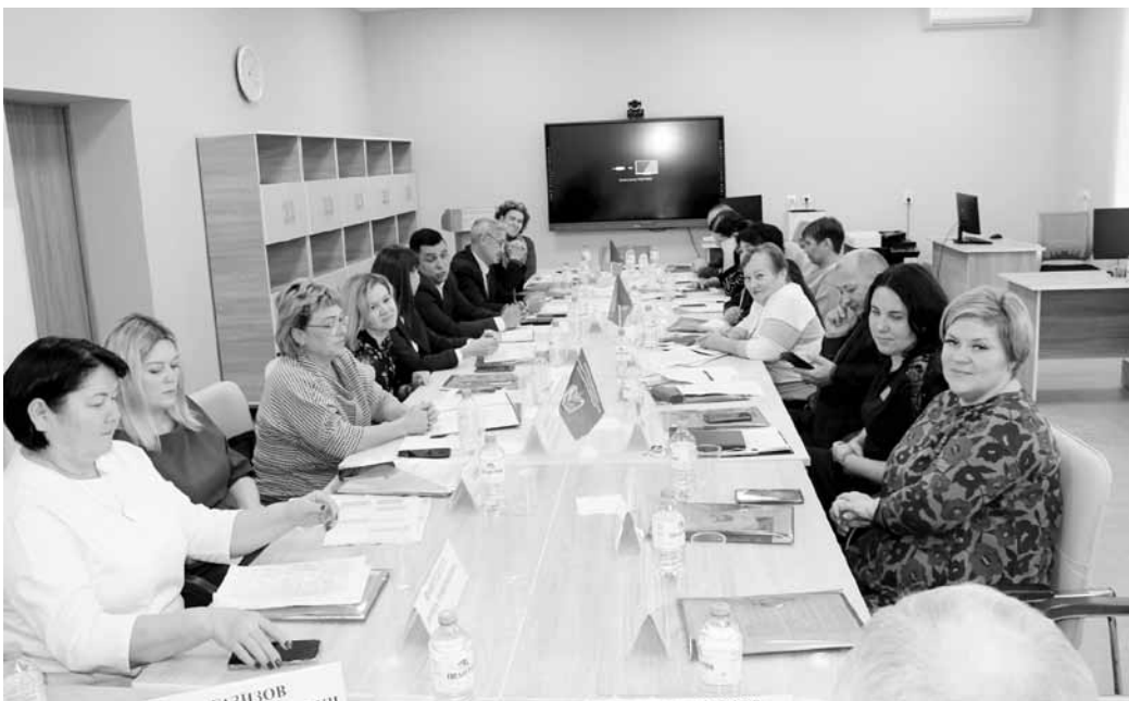
Участники семинара обменялись опытом