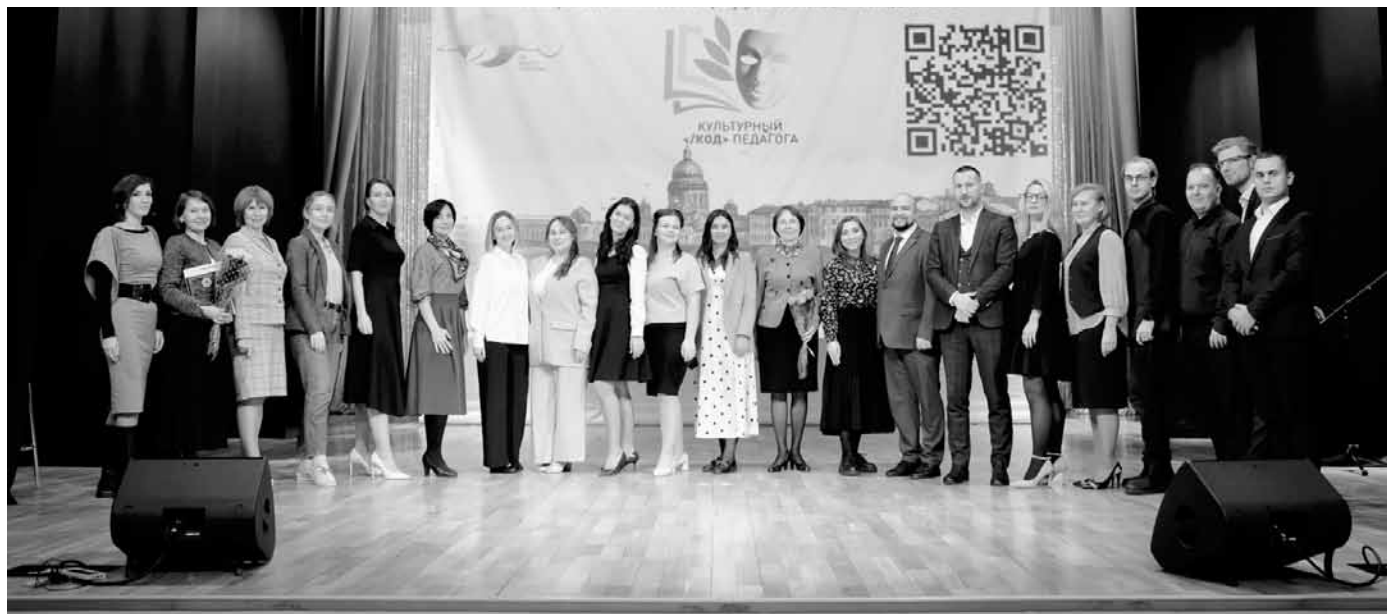
В одной команде - организаторы и спикеры форума