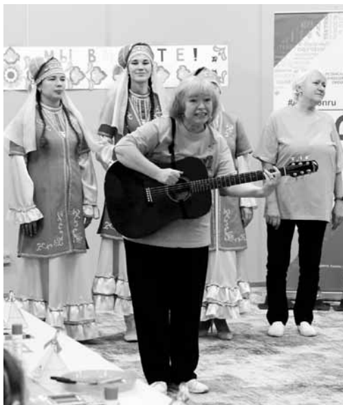
Что за праздник без песен?

С командой Центра детского творчества Вахитовского района Казани взрослые и дети мастерили из бумаги кукол в татарских костюмах, пели, танцевали, играли, а в конце украсили национальным орнаментом большую общую открытку с надписью: «Мы вместе». Настроение малышам подняли перчаточная кукла в виде казанского кота по имени Перемяч и, конечно, подарки.