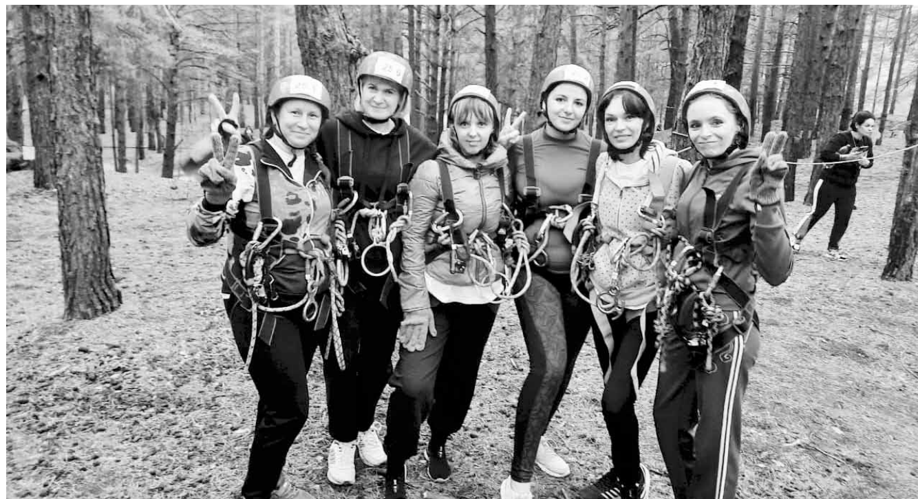
Начинающие учителя - участники слета