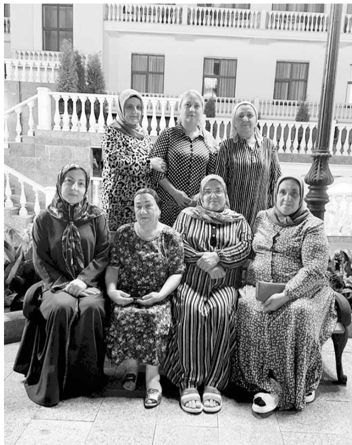
Учителя ачхой-мартановской школы №1 перед зданием санатория имени Г.Димитрова

- Нам с коллегой повезло вместе поехать в санаторий «Лесная поляна» в Пятигорске. Выражаем огромную благодарность Профсоюзу образования за внимание к нам, учителям, так нуждающимся в от-