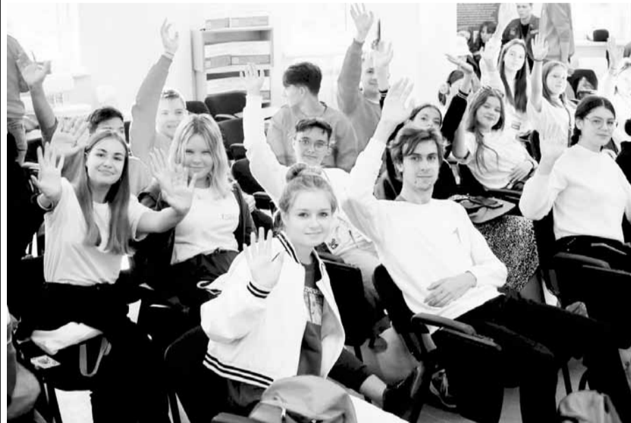
Школьники из ЛНР в Воронеже

В рамках поездки для учеников школ из ЛНР были проведены экскурсии в учебно-производственный комплекс беспилотных