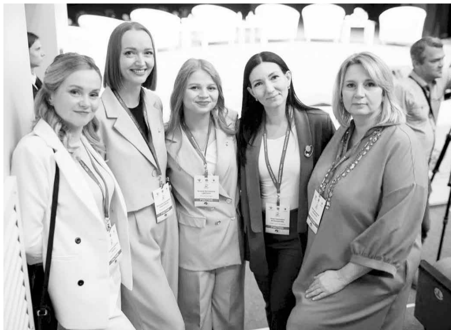
Пятерка призеров «Воспитателя года России»

- У нас колоссальная ответственность. Основная задача - всех довести до места,