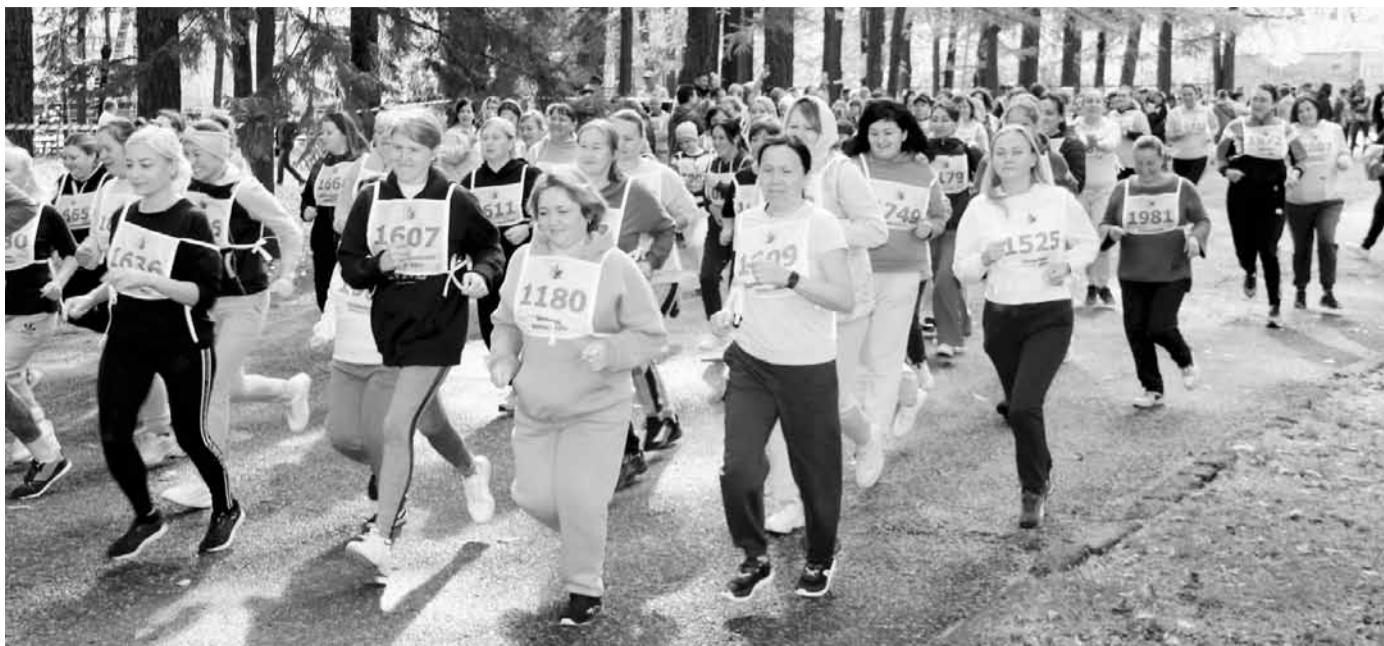
Забегу получились динамичными и зрелищными