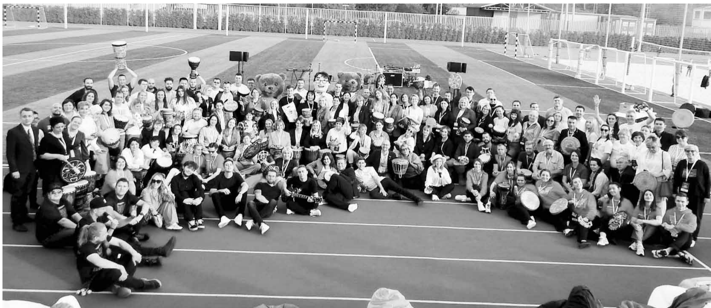
Общее фото на память