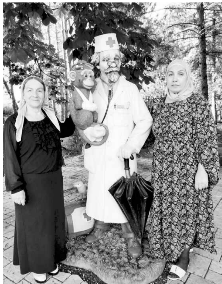
Педагоги 4-й грозненской гимназии отдохнули в санатории «Лесная поляна»

- Большое спасибо профсоюзу за акцию по оздоровлению педагогов с хроническими заболеваниями. С учительской зарплатой нам сложно отложить средства, чтобы выехать в санаторий. Профсоюз нам помог! Я очень довольна, что смогла поправить свое здоровье.