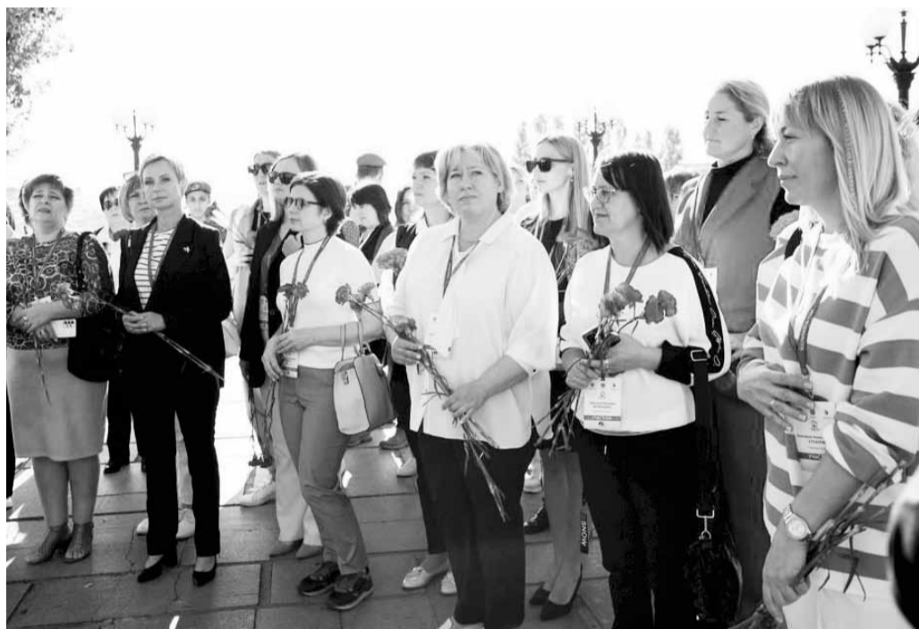
На Мамаевом кургане

всех привезти обратно в отель, и чтобы это было максимально комфортно.