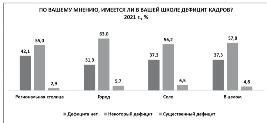
Рис. 1. Оценка учителями кадровой ситуации в школе, %

По данным РАНХиГС 1 , более половины учителей сообщают о наличии в их школе некоторого кадрового дефицита, почти 5% сообщают о существенном дефиците кадров.