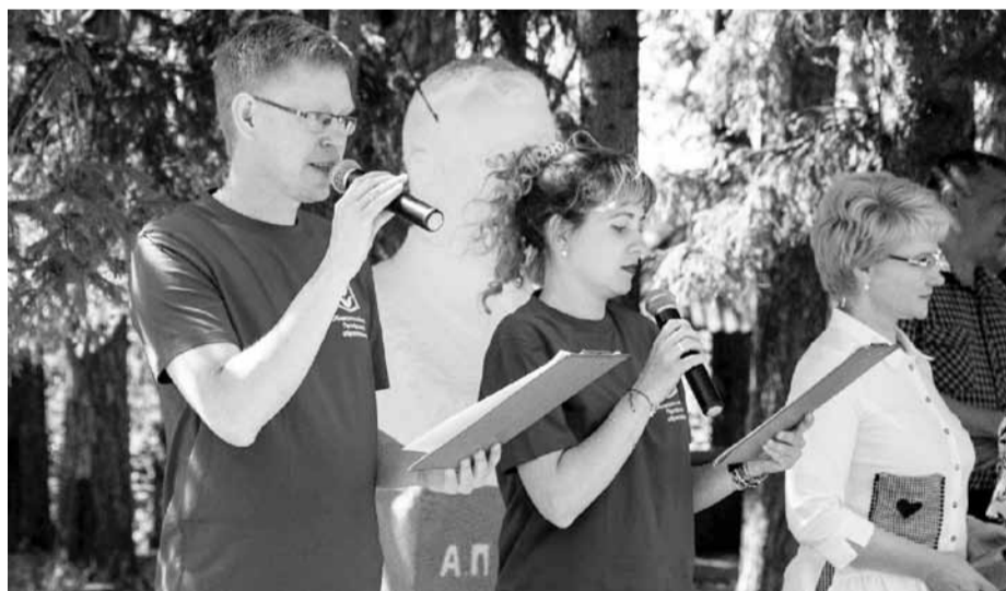
Открытие XIII Межрегионального форума молодых педагогов и наставников «Таир», 26 июня 2022 года