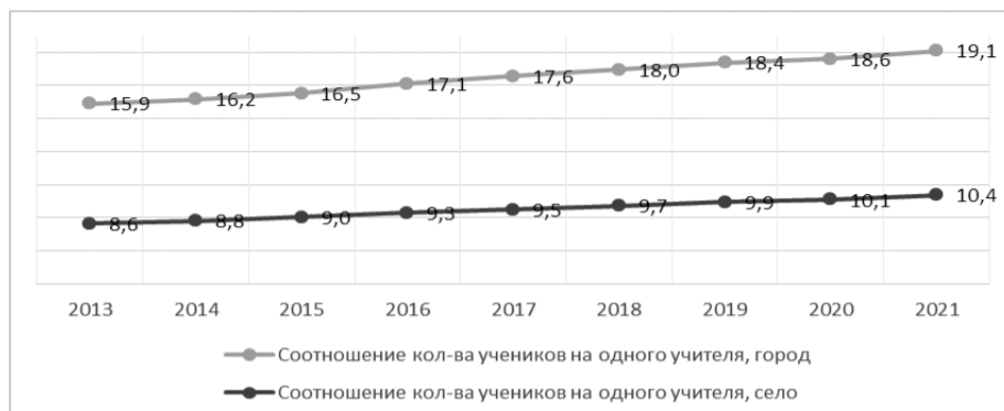
Рис. 3. Динамика соотношения численности обучающихся в расчете на одного учителя (без учета совместителей) в среднем по РФ, в городской и сельской местности, человек

тированной на повышение среднего уровня заработной платы учителей за счет повышения их нагрузки.