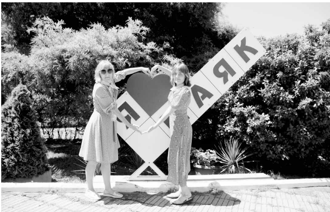
Амбассадоров подружил «Маяк»

Завершается тренировочный сезон в конце апреля главным событием года - со-