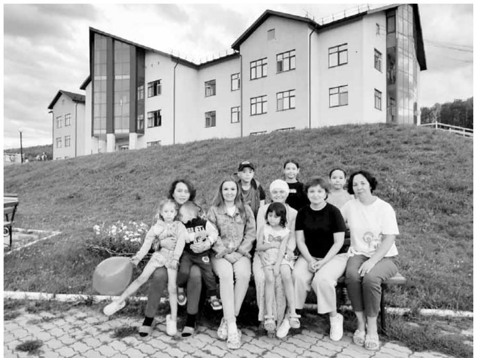
В санаторий «Сакмар» мамы приезжают вместе с детьми

- «Ай» находится в сосновом бору на берегу реки. Прогуливаясь по лесу, вдыхая за-