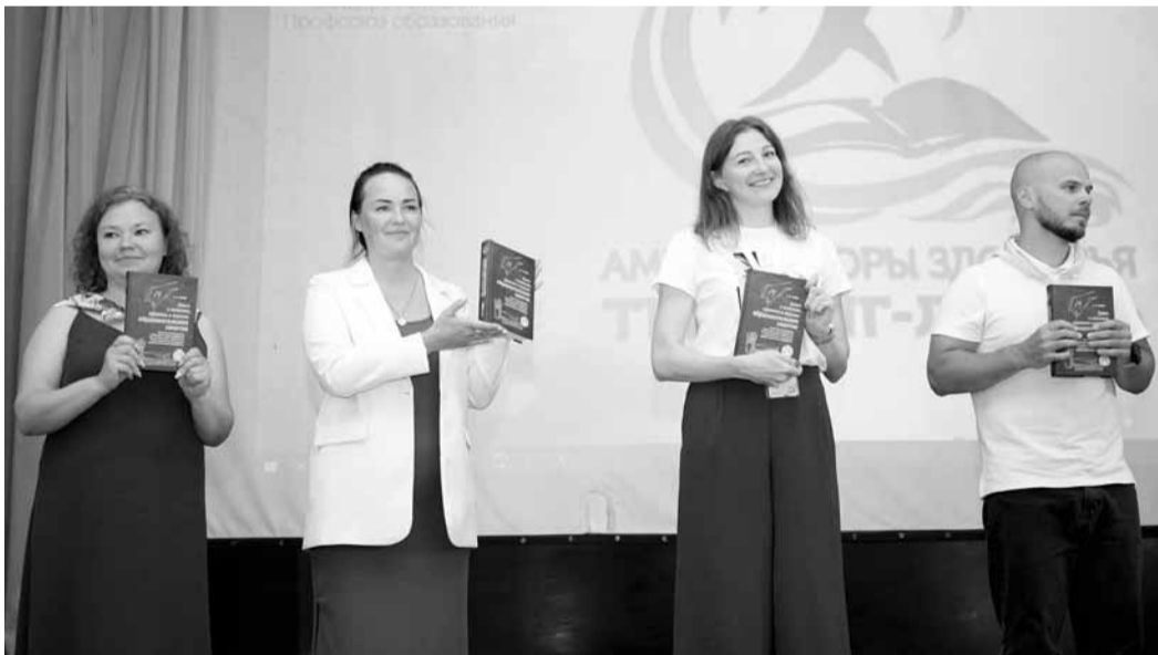
Победители конкурсов профессионального мастерства выступили перед участниками лагеря и получили в подарок книгу

Ускоряться и адаптироваться к новой реальности придется не детям, а учителям. Один из способов, который предложила