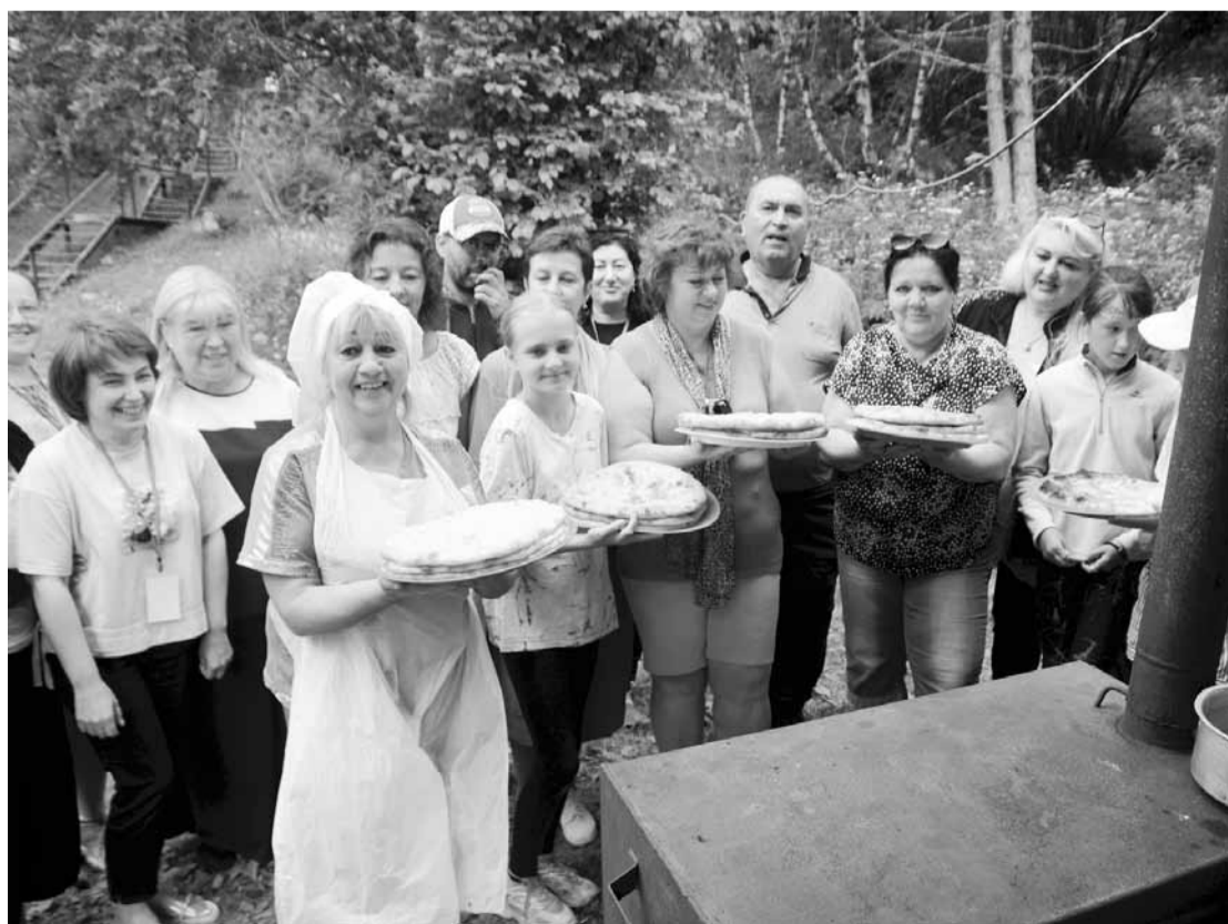
Осетинские пироги удалась!

Какой он, портрет участника летней школы «Учитель года», созданный в Северной Осетии? Это картина с настроением - в ней отражены радость встреч и слезы расставания, удивления и открытия, готовность делиться опытом и вести за собой, смелость покорения новых вершин, настоящее профессиональное счастье учителя. Спасибо, Кавказ, за это счастье! До новых встреч! До новых вершин!