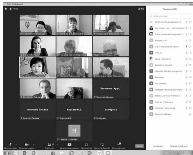
В 2022 году майская встреча прошла в режиме онлайн

Например, в 2019 году в Санкт-Петербурге обсуждали защиту трудовых прав членов профсоюза с участием правовых (главных правовых) инспекторов труда.