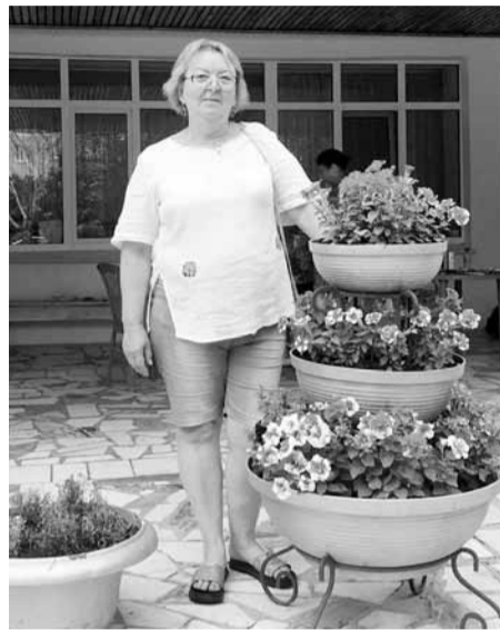
Санаторий «Тонус» работает с Башкирским рескомом профсоюза не первый год

Народная мудрость гласит, что болезнь легче предупредить, чем лечить. Именно поэтому в течение многих лет Башкирский реском Профсоюза образования организует оздоровление работников - членов профсоюза и молодых мам с детьми в летнее время. Отдыхающие оплачивают лишь половину стоимости путевки, остальную часть расходов берет на себя реском.