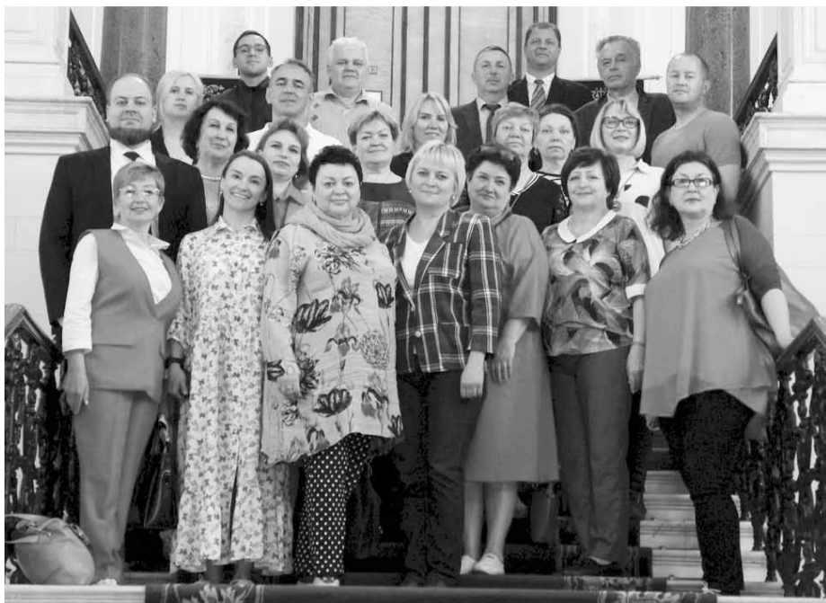
Участники семинара-совещания в Санкт-Петербурге. 2021 год

В одних регионах профессиональное сообщество работников образования относительно стабильно, тогда как в других отток населения фактически ставит профсоюзы на грань выживания. С проблемами можно и нужно работать. Главное - не опускать руки, не прятать голову в песок, а отвечать на возникающие вызовы открыто, гласно, вместе. Именно так поступают организации Общероссийского Профсоюза образования в регионах Северо-Западного федерального округа.