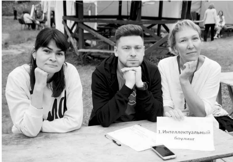
Интеллектуальное занятие на свежем воздухе