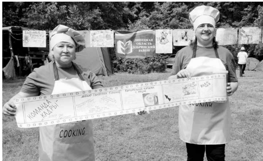
Повара команды «Кадры» средней школы села Пушкино Добринского района Липецкой области