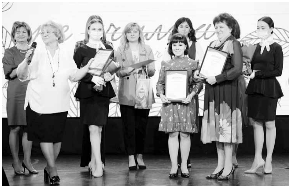
Награждение победителей конкурса «Звездный час», 2021 год

В Тюменской области развивают систему наставничества