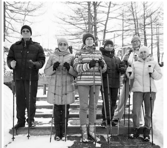
Сдаем нормы ГТО по скандинавской ходьбе

Оздоровительная профсоюзная программа охватывает не только «активных и спортивных». Она включает и такие направления, как суставная гимнастика, оздоровительный бег. В качестве эксклюзивных практик в рамках «Школы здорового образа жизни» реализуются программы «Убегаем от