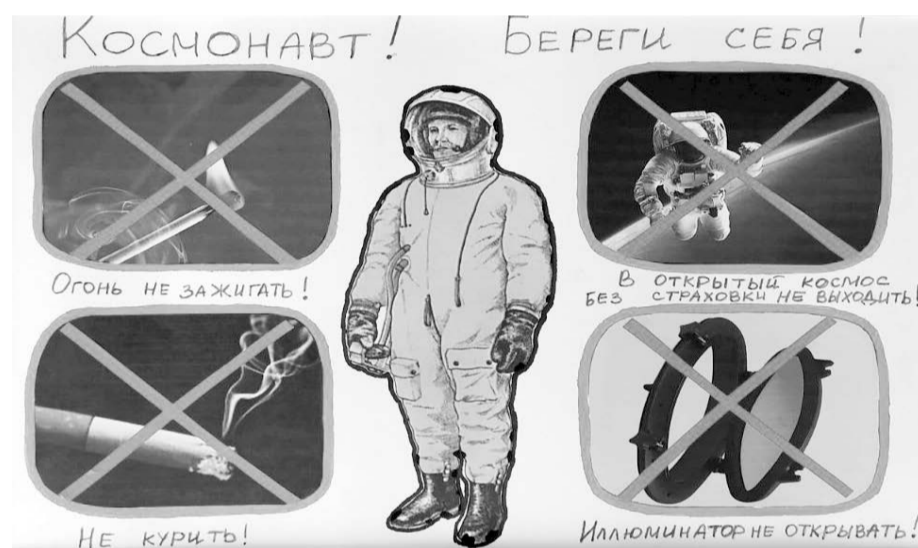
Работа Руслана ДЕМЬЯНОВА, 6 лет

улучшение условий труда в образовательной организации?