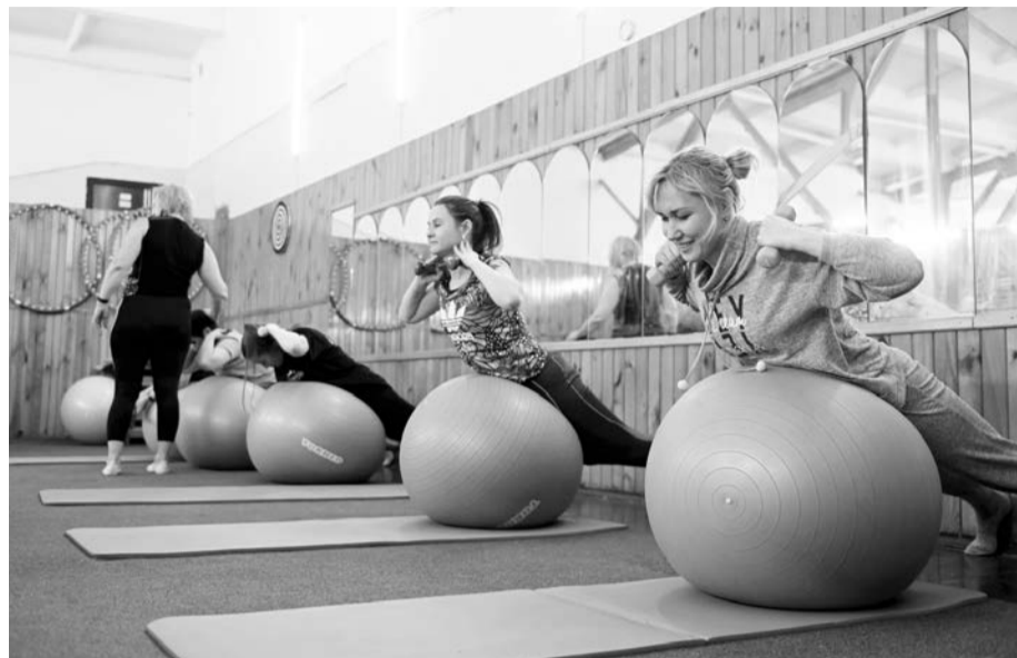
Упражнения на фитболах

Отметим, что оздоровительные тренировки организованы в вузе с февраля 2021 года, и за это время сформировалась постоянная группа. Для тренера важно не навредить ослабленному болезнью организму, а помочь восстановиться и окрепнуть. Поэтому посещение занятий свободное, а упражнения и нагрузка сопровождаются рекомендациями, на какие «сигналы» организма необходимо обратить внимание. Видимо, из-за такого чуткого подхода по-