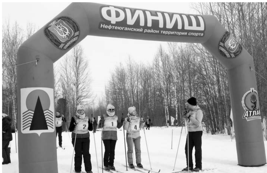
Заряд бодрости получили все, независимо от призовых мест

Торжество пришлось на третье апреля, день, когда впервые в этом году весна под Нефтеюганском дала знать о себе потекшими сугробами, лужами, ласковым солнышком и неистовым пением синиц. Правда, пернатые в этот день, похоже, и сами себя не слышали: поселившуюся на лыжной базе поселка Пойковский тишину прогнал шум учительских бивуаков: спар-