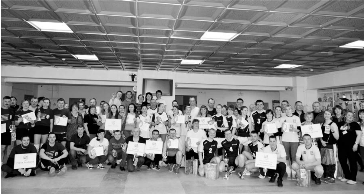
Участники соревнований с заслуженными наградами