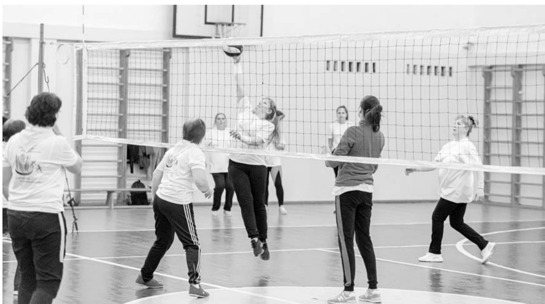
Первенство по волейболу в Нижней Туре

Пресс-служба Свердловской областной организации Общероссийского Профсоюза образования