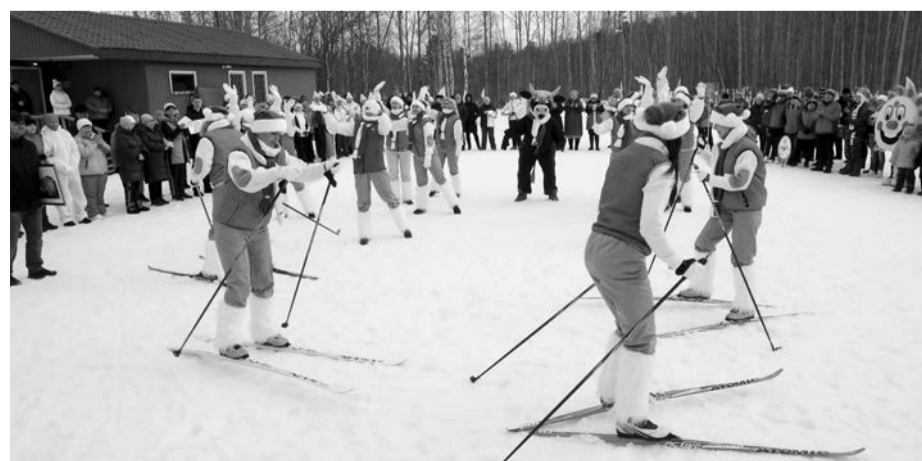
Веселая разминка перед стартом

такиада - это не только спортивные этапы, но еще творчество и общение, и наконец-то не онлайн.