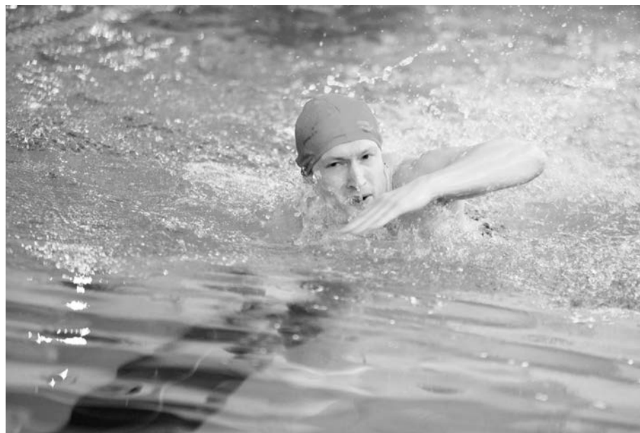
В Алапаевском районе прошли соревнования по плаванию

Три дня педагоги повышали свою квалификацию, а также участвовали в различных командных мероприятиях. Отметим, что команды были сформированы по межрайонному принципу, что способствовало рас-