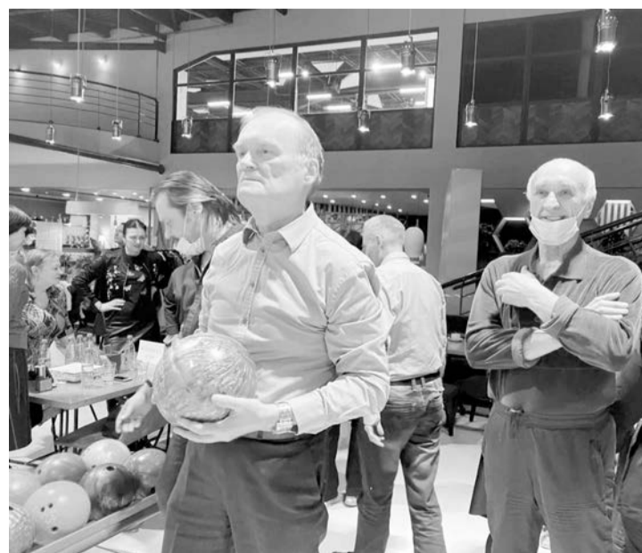
Преподаватели УГЛТУ играют в боулинг