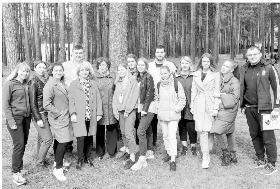
Молодые педагоги на выездном тренинге

Праздник активного образа жизни длится не один месяц