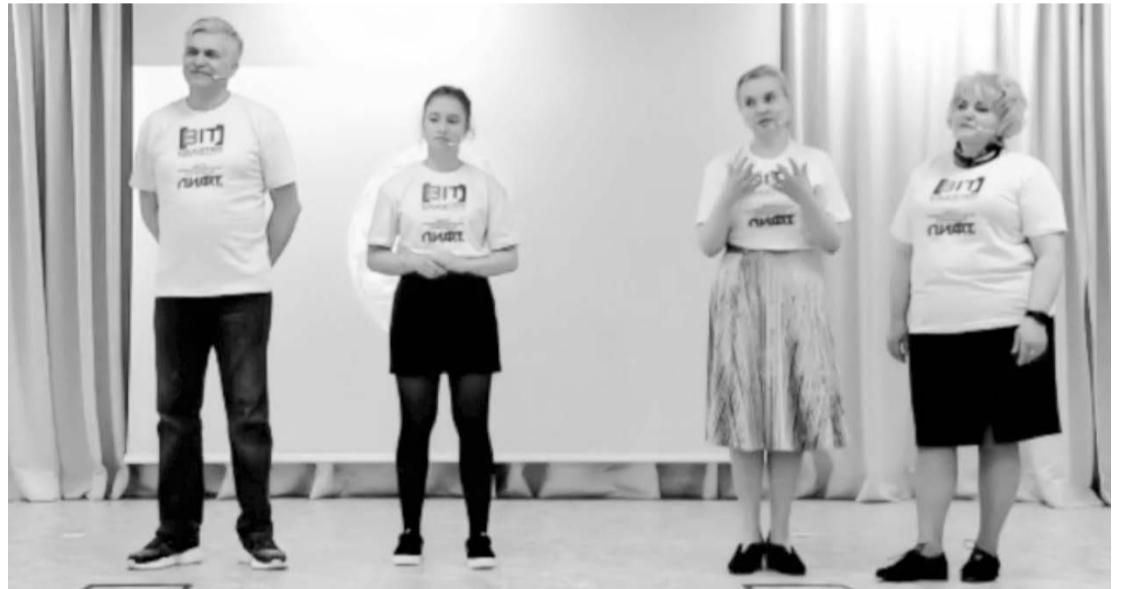
Команда школы №82 Новосибирска стала абсолютным победителем конкурса