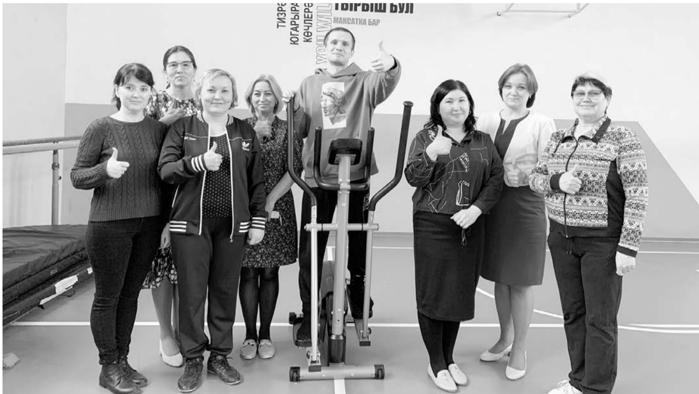
Коллектив гимназии №5 очень рад такому подарку

Весенний авитаминоз и покупка абонемента в тренажерный зал теперь неактуальны для членов профсоюза образовательных учреждений Авиастроительного и Ново-Савиновского районов Казани. Заботу об их здоровье взяла на себя территориальная профсоюзная организация в рамках Года спорта, здоровья и долголетия.