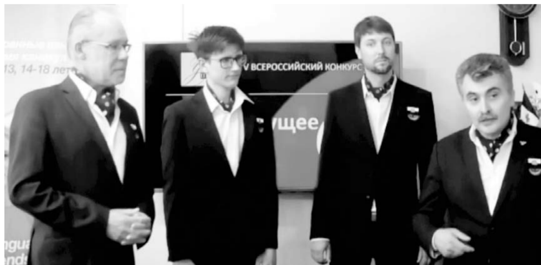
Гимназия №14 Глазова - серебряный призер

Не все команды успели за отведенное время разработать детальный план преодоления