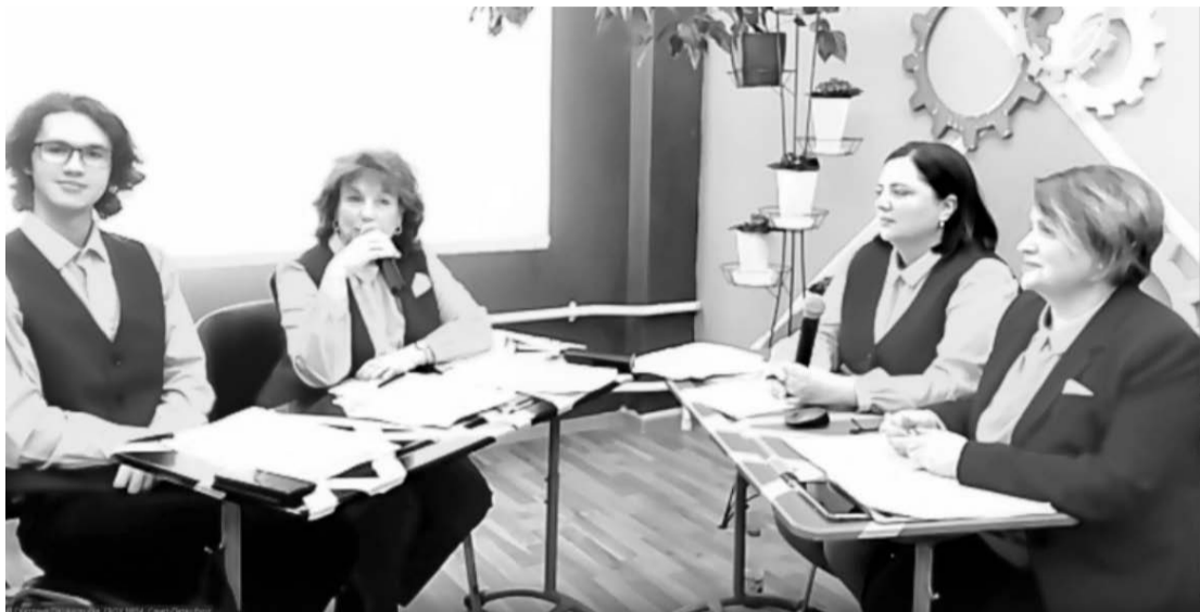
В петербургской школе №54 развивают инженерное мышление