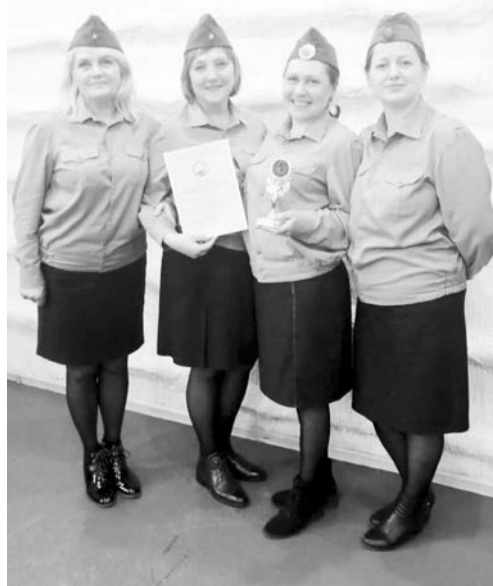
Вокальная группа детского сада «Солнышко»