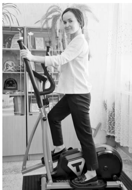
Молодые педагоги школы №71 занимаются на тренажере после уроков

Викторина «Хорошо ли вы знаете фрукты?» прошла в детском саду №19.