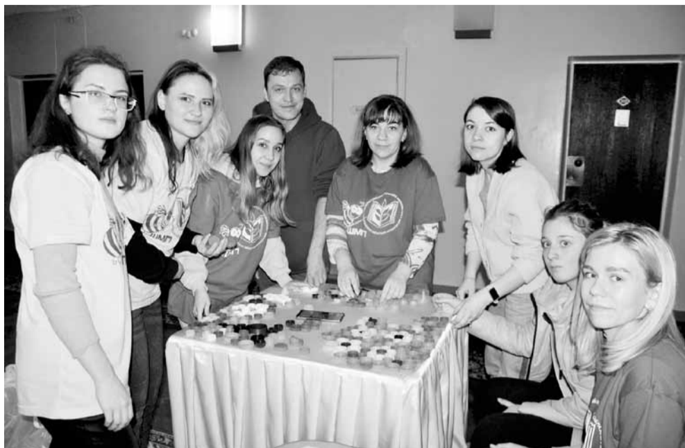
Работа над картиной из бутылочных крышек в самом разгаре