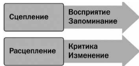
Схема 4. Источник и реципиент

Но информацию надо не только запоминать и воспроизводить. В современном мире надо еще и уметь забывать, избавляться от ненужных сведений, проводить «информационную инвентаризацию». Между реципиентом (получателем, пользователем) и источником информации может происходить не только сцепление (возникновение взаимодействия), но и расцепление, что продемонстрировано на схеме 4.