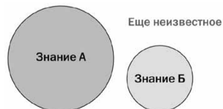
Схема 1. Границы между познанным и неизвестным

Наполненность знаниями. Один учитель показал ученикам сосуд, наполненный камнями, и спросил: «Полон ли сосуд?» Большинство ответило «Да». Тогда учитель взял песок и стал насыпать, пока песчинки не заполнили все пространство между камнями.