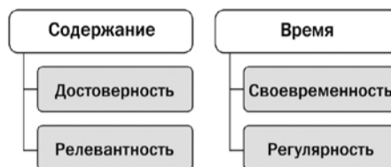
Схема 3. Критерии отбора информации для занятия

информация на занятии не должна превращаться в мелькающий перед глазами калейдоскоп и винегрет из сведений, но при этом надо избегать и обратной ситуации - пережевывания одного и того же по несколько раз и «размазанной по тарелке» содержательной каши. Торопливость нередко приводит к поверхностности, а медлительность - к редуцированию и примитивизации содержания, ощущению потери времени, скуке и тягучести под видом закрепления и глубокого усвоения материала. Усыпляющий стиль ведения занятия можно назвать «эффектом Кота Баюна», но убаюкивание в образовании не имеет перспектив - пусть при получении информации возникает работа мысли, а не безмятежность и умиротворяющее состояние.