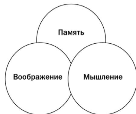
Схема 2. Структуры восприятия текста

Для комплексного восприятия и понимания человеку нужны внимание (не упускать важное, наблюдать, подмечать и фиксировать), память (переработка и возможность воспроизведения в дальнейшем), воображение («домысливание» и «достраивание» ситуаций, создание образов, представление), мыслительные операции анализа и синтеза (переработка информации, ее обобщение или, наоборот, разделение на части), удерживание интереса к теме . Поэтому при восприятии информации важно сочетание памяти, воображения и мышления (см. схему 2).