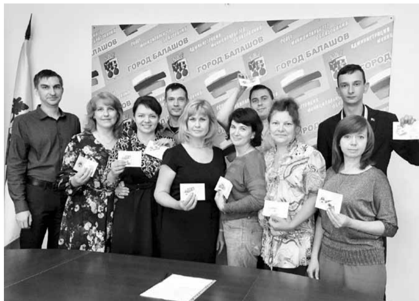
Коллективу вручают золотые значки ГТО

Торжественное награждение проходило в отделе по спорту и молодежной политике администрации Балашовского района. Сотрудники школы №9 стали не только одним из первых педагогических коллективов, сдавших нормы ГТО, но и одним из лучших по итоговым результатам. Помимо заслуженных наград по инициативе пред-