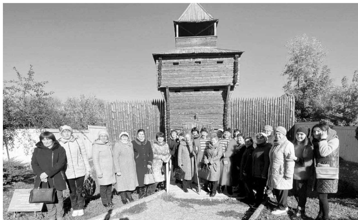
В музее «Засечная черта», Ульяновск, 2022 год