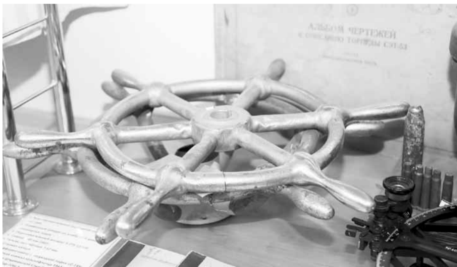
Экспонат школьного музея

Конечно, мы не забываем о ветеранах, относимся к ним с глубоким почтением. При городской организации профсоюза действует Совет ветеранов. С каждым годом ветеранов Великой Отечественной войны все меньше. Но каждый год накануне 9 Мая мы приглашаем их в городской комитет профсоюза, накрываем стол, а творческий коллектив Дома учителя готовит для них концерт. Ветераны каждый год ждут этих встреч. А на 9 Мая мы выделяем им от профсоюза пригласительные билеты на основную трибуну на площади Нахимова, где в день нашей севастопольской и общенародной Победы традиционно проходит военный парад.