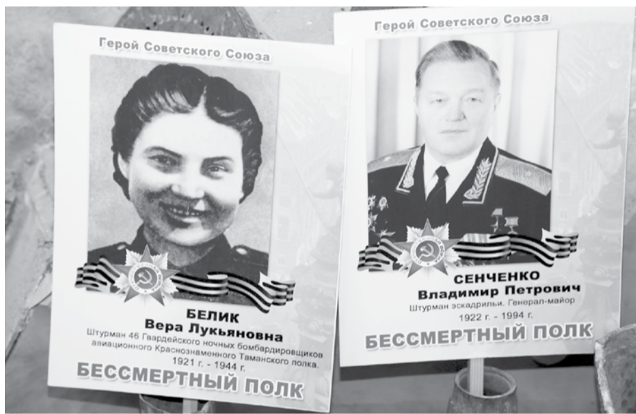
Штандарты с портретами Героев Советского Союза - выпускников школы №17

Учительница с ребятами отправились в Севастополь в гости к вдове. Оказалось, она утилась в ветхом домишке вместе со слепой сестрой мужа. «Непорядок», - решили дети и отправились в военкомат. А там начали выяснять, почему родственники героя живут в таких плохих условиях. В результате семье выделили квартиру в Севастополе на Большой Морской улице.