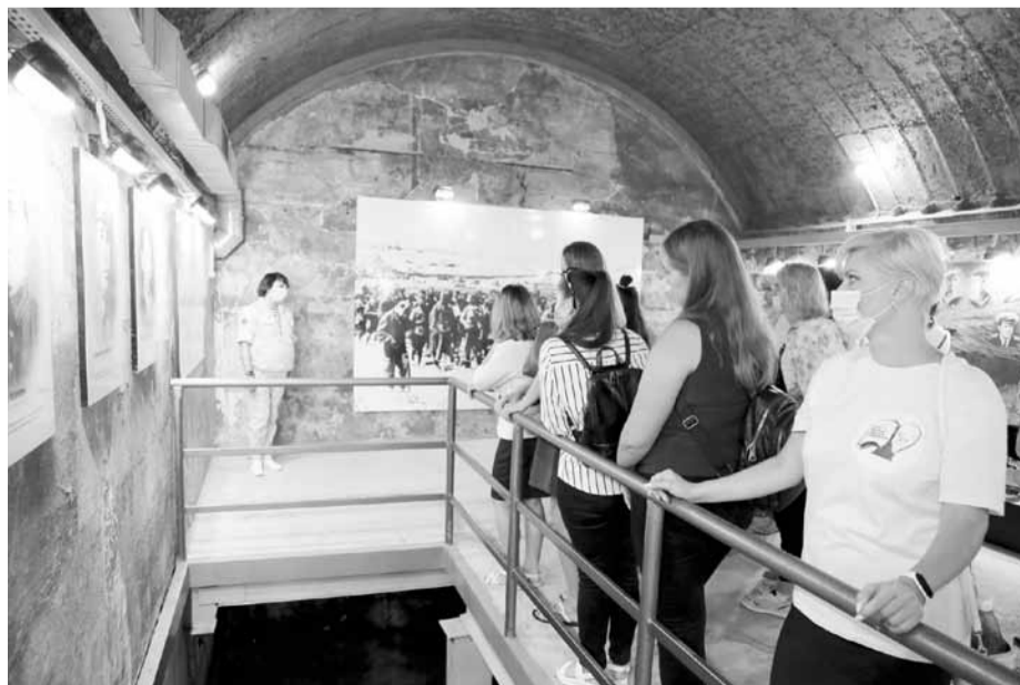
В казематах 35-й батареи молодые педагоги ознакомились с ее историей

- 35-я батарея - это священное место для всех севастопольцев. Важно, что теперь и вы знакомы с ним близко и можете передать это знание своим ученикам.