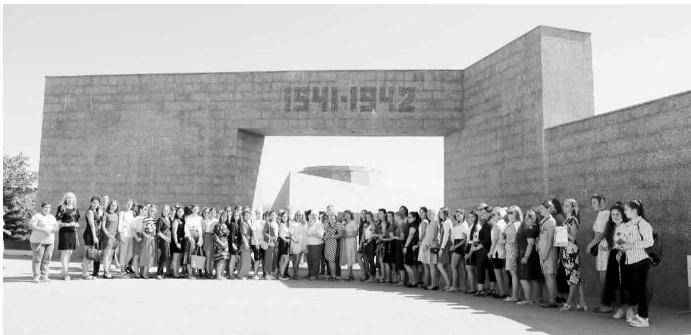
Участники форума у мемориальной арки музейного комплекса «35-я береговая батарея»

Победа пришла на Херсонес весной 1944 года. 5 мая части Красной армии подошли к городу, 7 мая была проведена мощная артподготовка по Сапун-горе - ключевой оборонительной позиции на подступах к Севастополю. И наши воины двинулись в атаку, взяли неприступную по всем параме-