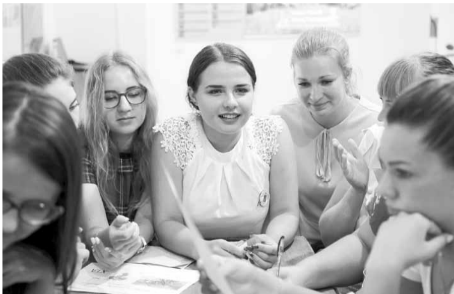
После экскурсии участники форума выполняли конкурсные задания