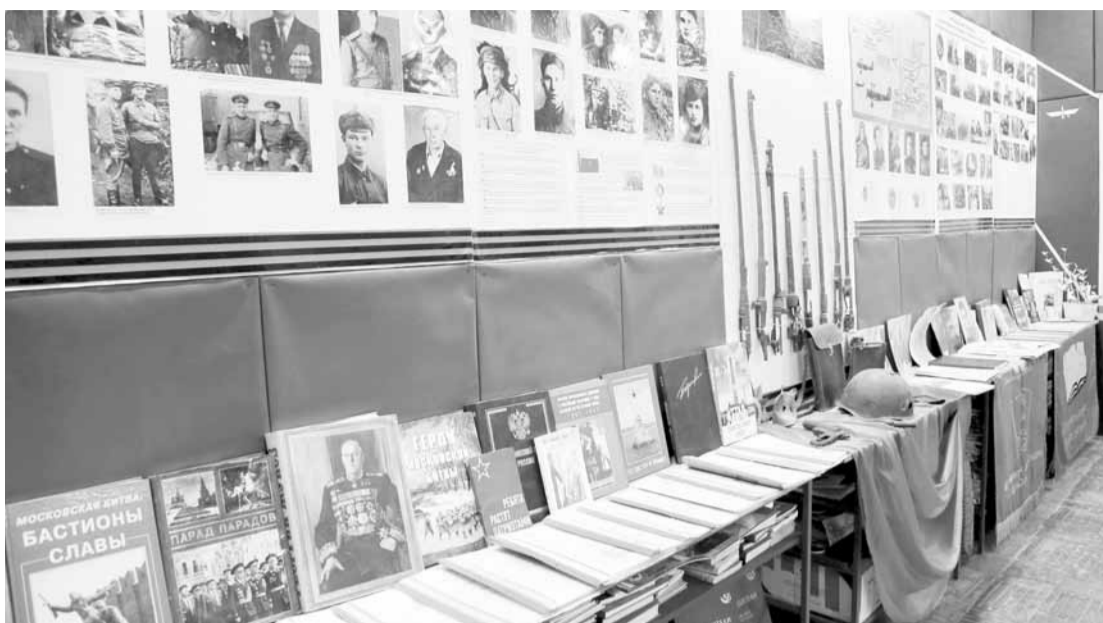
В музее боевой славы школы №17

вали плацдарм на участке от Азовского моря до предместий Керчи.