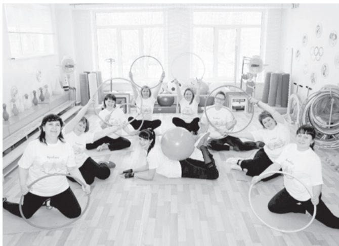
Детский сад №29 «Светлячок» города Кулебаки

А параллельно с конкурсными заметками мы получаем вести из первичных организаций о том, как они организуют мероприятия для оздоровления работников образования. Эти тексты и фотографии появляются в группе Общерос-