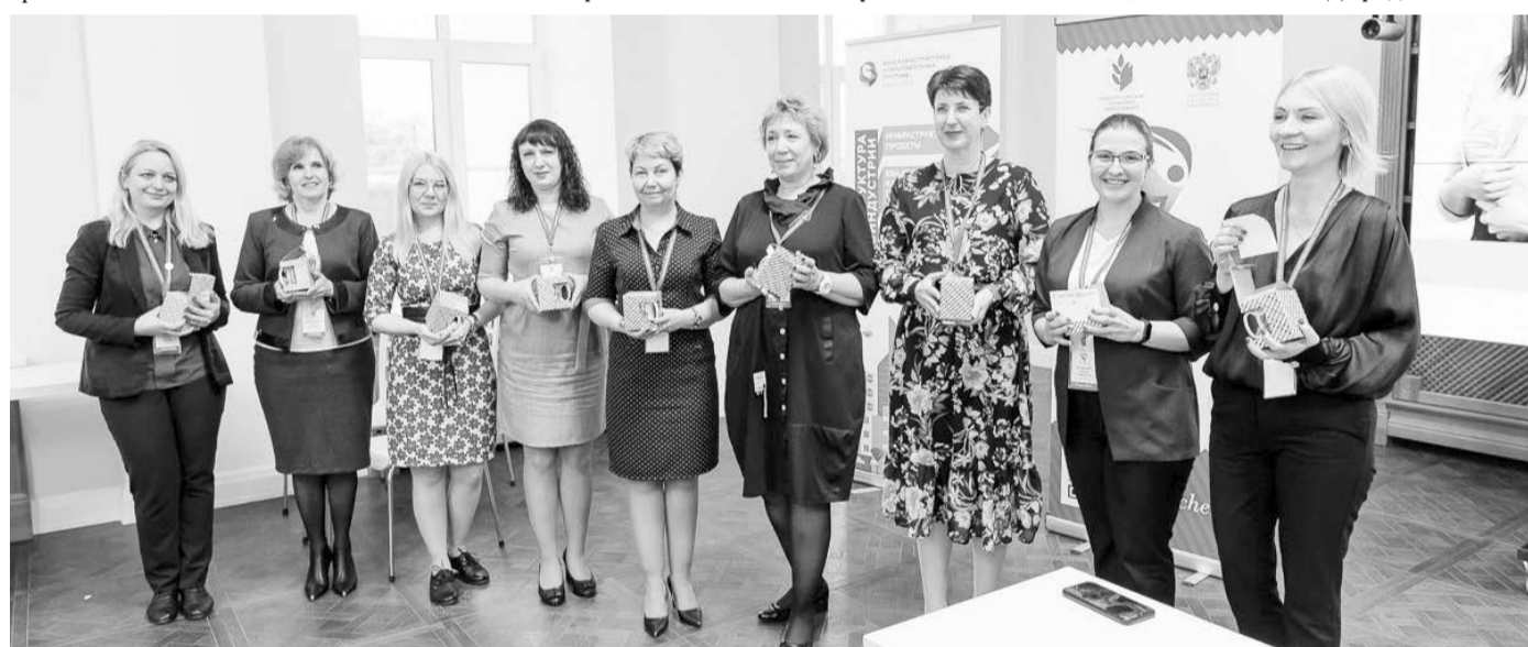
Лауреаты олимпиады «Мой первый учитель»-2020