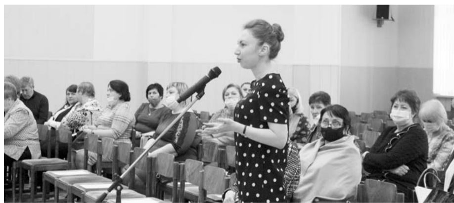
На пленуме обсудили проектную деятельность профсоюза

Саратовская область первый год участвует в федеральном проекте «Цифровизация Общероссийского Профсоюза образования». Создан единый реестр членов профсоюза, на 1 марта текущего года зарегистрировано 92% общего состава, элек-