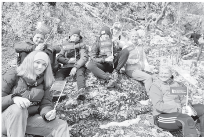
Команда лицея №87 Московского района Нижнего Новгорода

сийского Профсоюза образования ВКонтакте vk.com/eseur . Делимся новостями из Нижегородской области.