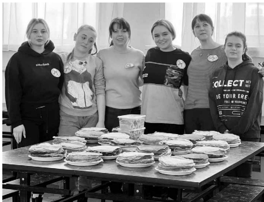
Самые вкусные блины от самых красивых девчат