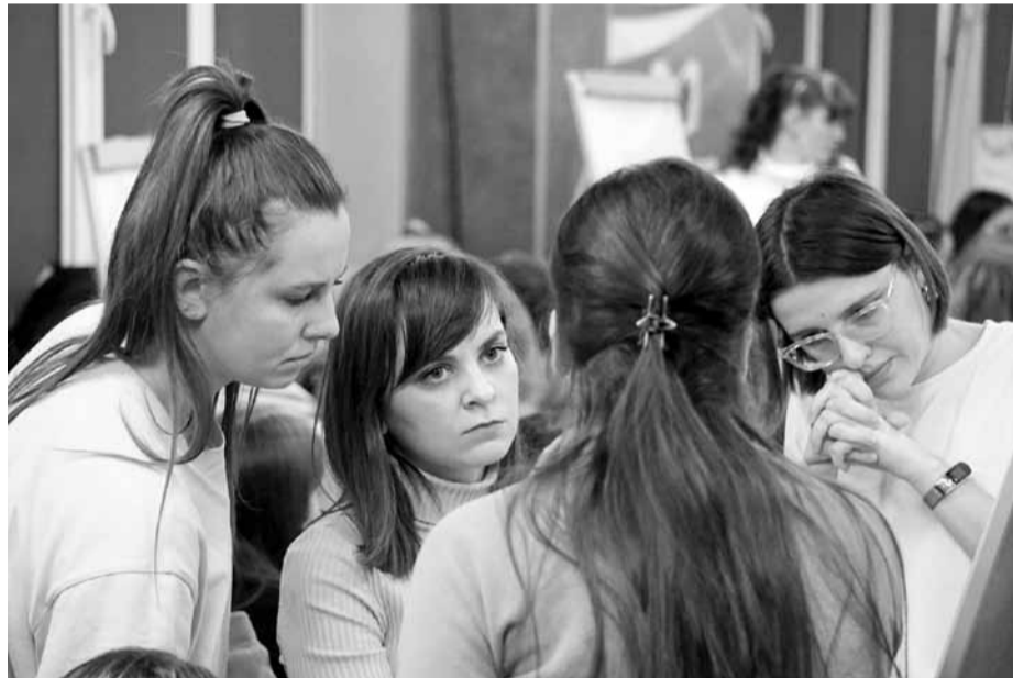
Размышления о проблемах

титесь в территориальную профсоюзную организацию или даже в областную - поможем!» Описали свой идеальный рабочий день, где есть место профсоюзной работе. Да-да, профсоюзные лидеры ведь остаются учителями, воспитателями, завучами и так далее... Успевают все - потому что умеют себя организовать, умеют планировать (ежедневник всегда под рукой), постоянно вдохновляются на массовых очных профсоюзных мероприятиях.