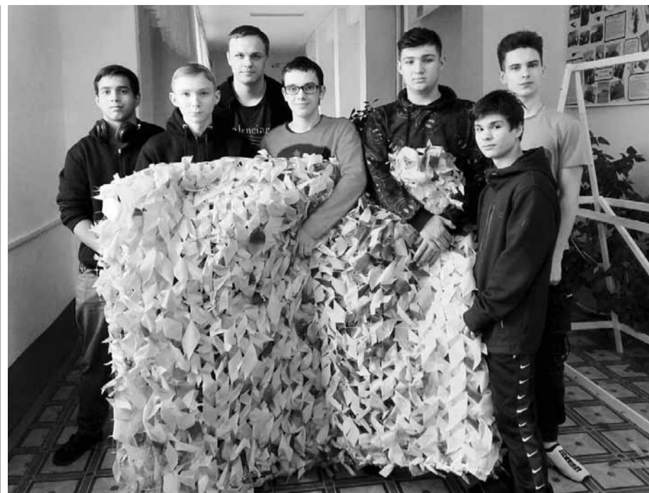
Маскировочные сети защитят наших бойцов