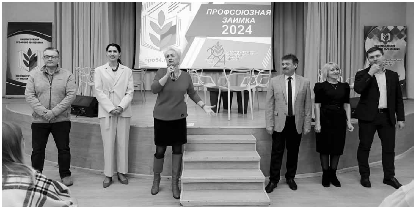
Ассоциация участников профессиональных конкурсов