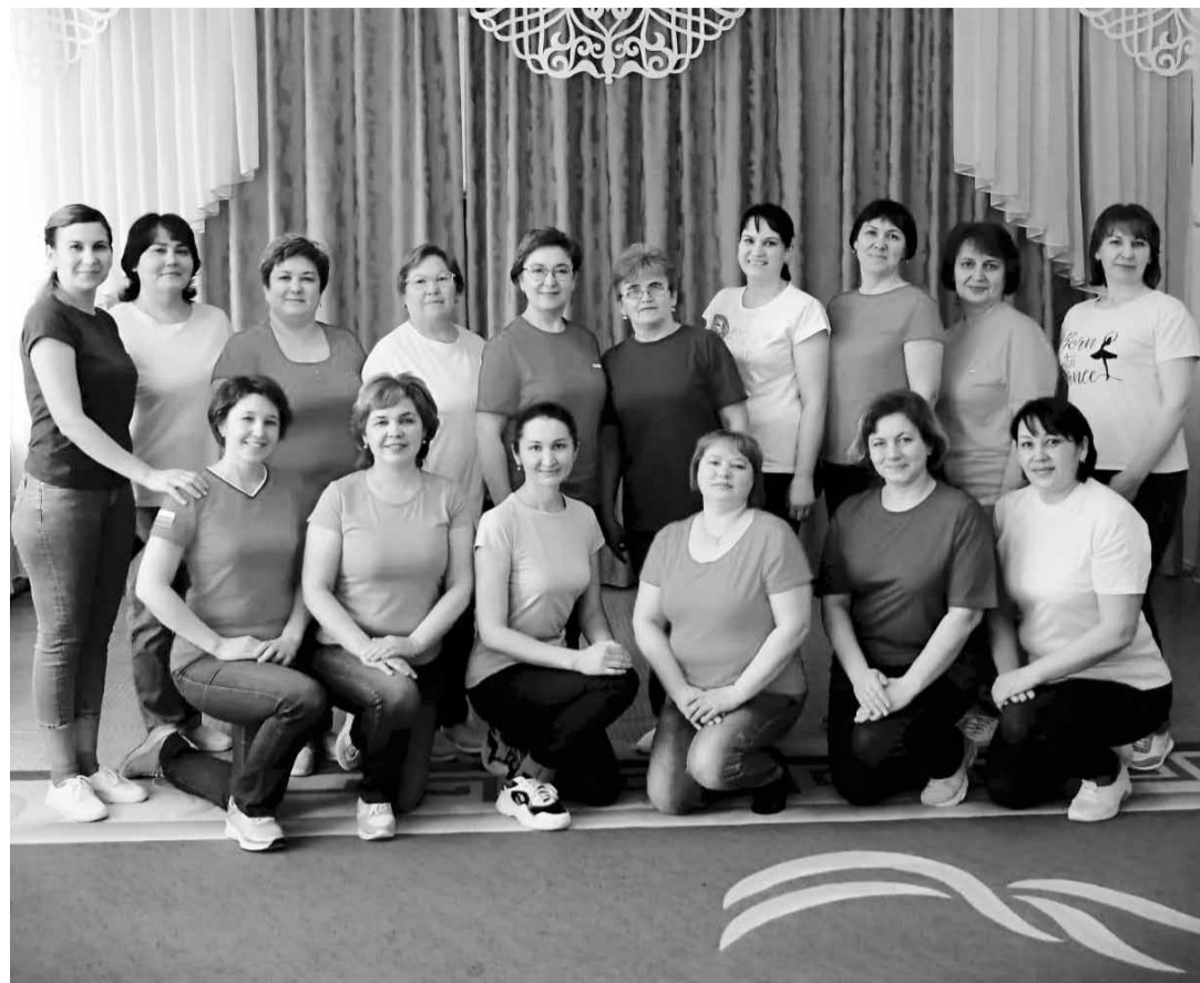
Сотрудники детского сада - коллектив единомышленников