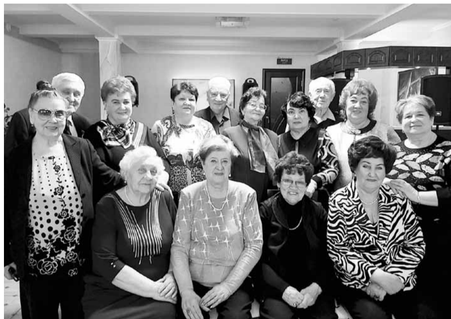
Участники встречи «Команда молодости нашей»

Профсоюз организовал праздник для ветеранов