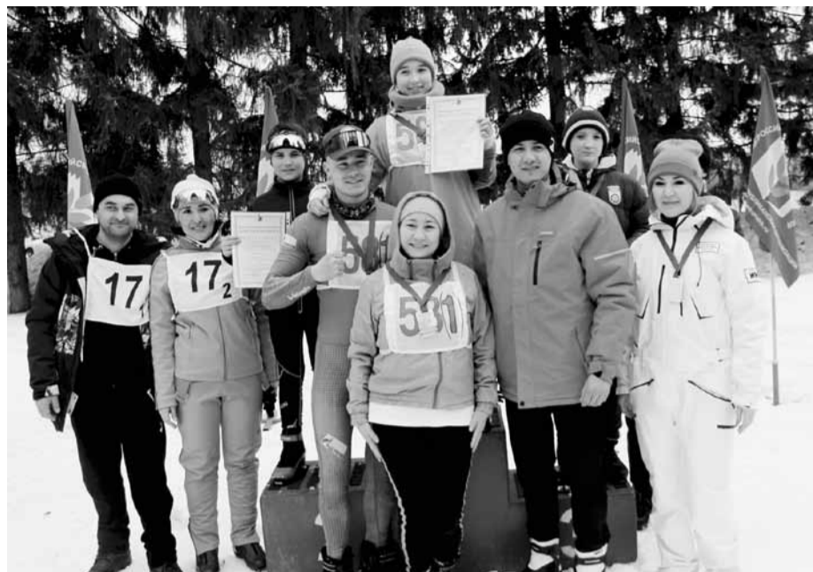
Награждение победителей семейных стартов