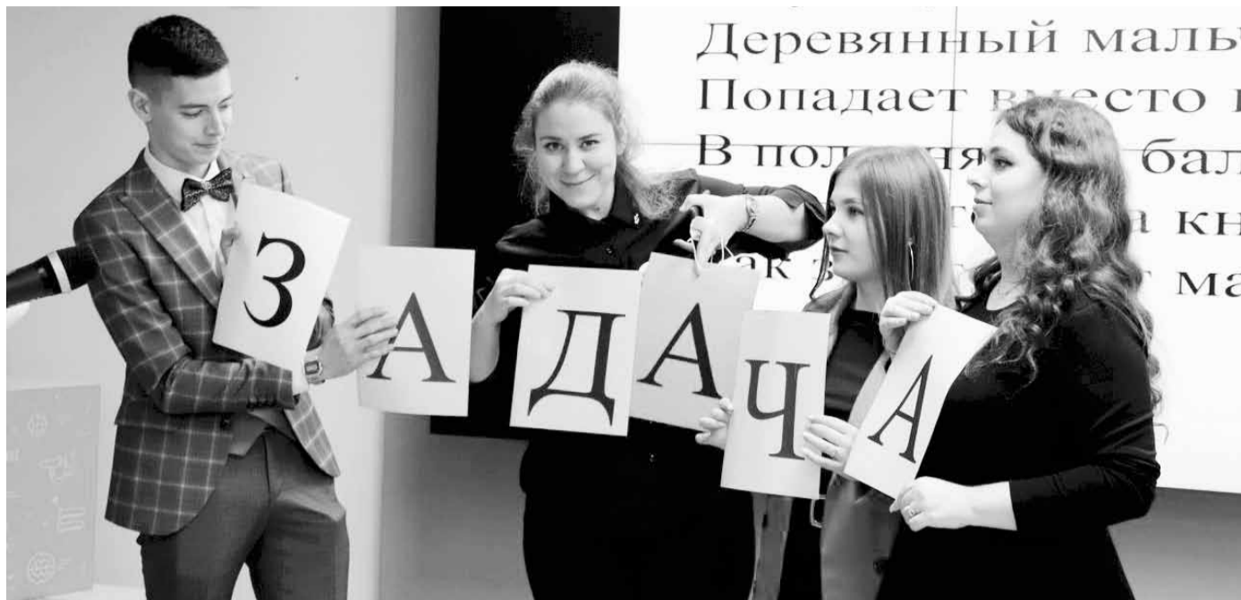
Демонстрация фрагмента урока на областном финале конкурса «Молодой учитель»-2021

- Если честно, я не предполагала такого результата. Победа на районном этапе была для меня неожиданностью, ведь вместе со мной участвовали такие яркие конкурсанты. Да и в финале третье призовое - это классно. Рада за коллегу - учителя музыки