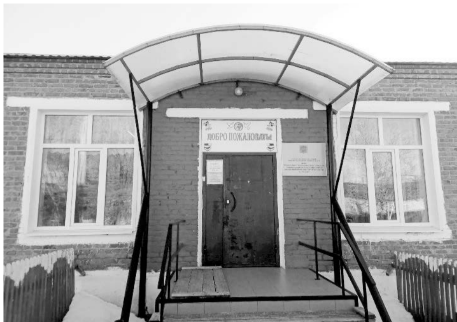
Добро пожаловать в Савельевскую школу!

Скажем сразу, средняя зарплата учителей образовательных учреждений Саратовской области соответствует средней по экономике и имеет твердую тенденцию к увеличению. Летом правительство региона издало постановление об очередном 10%-ном повышении с 1 августа 2021 года. Однако система оплаты труда педагогов, основанная на стоимости ученико-часа, оставаясь непрозрачной, в очередной раз привела к конфликтной ситуации.