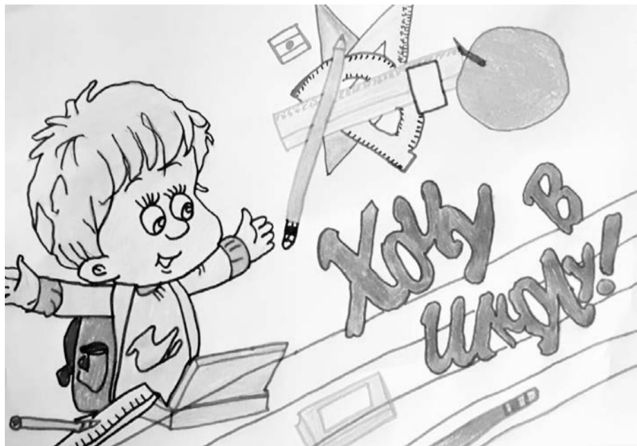
В период пандемии в сельской школе провели конкурс детских рисунков

мусороперерабатывающего завода. Детей в селах проживает меньше год от года, сегодня половина школ района - малокомплектные. Савельевская школа в их числе. Правда, этого статуса она лишилась, став филиалом СОШ поселка Горный. В июне нынешнего года директор школы издал приказ о закрытии 2-й ступени образования в филиале, расположенном в селе Савельевка, ученики 5-9-х классов переводятся в школу п. Горный.