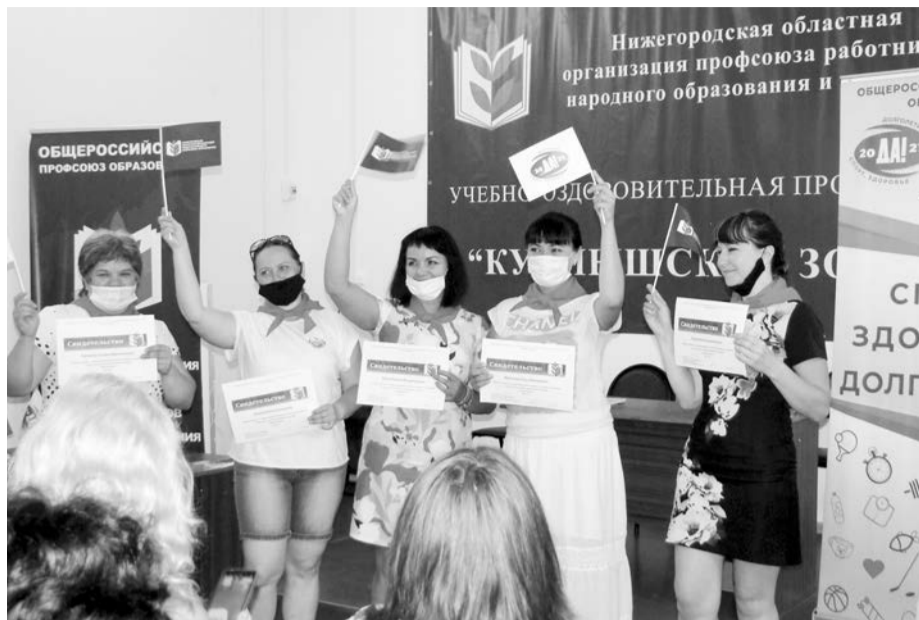
Все участники семинара получили свидетельства о прохождении обучения

В-третьих, программа всегда связана с темой года в Общероссийском Профсоюзе образования. Нынешняя учебная сессия посвящена спорту, здоровью и долголетию.