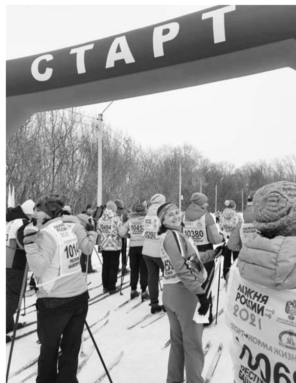
На Лыжне России

В 2019 году активистами проекта были предложены еще две программы. Первая из них - «Я - участник ГТО-движения». В 2019 году золотые знаки отличия получили два сотрудника, в 2020 году - пять. В 2021 году нормативы