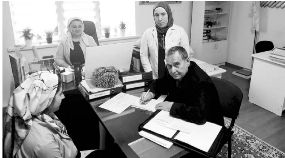
Диалог с воспитателями

На сегодня 922 проблемы педагогов из 1421-й, находящейся на контроле районного и первичного звена профсоюза, решены. Ресурс профсоюза уже оказал материальную