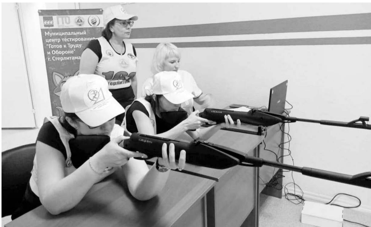
Сдаем нормативы ГТО

ГТО сдали 10 человек. За три года движением ГТО была охвачена треть коллектива.