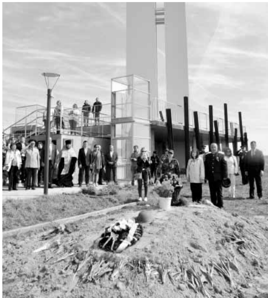
На Осетровском плацдарме

Участники автопробега стали свидетелями торжественного перезахоронения на плацдарме останков еще 153 воинов, найденных поисковыми отрядами начиная с октября прошлого года, в районе Осе-