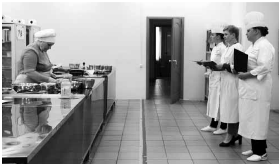
Члены жюри наблюдают за работой конкурсантов

- Все участники чрезвычайно сильные. Настоящие мастера своего дела. Мне было очень приятно оказаться в такой компании.